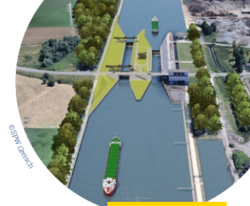
Toekomstige sluis - Obourg