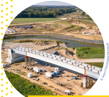
Brug over de RD66 in Montmacq - Cambronne-lès-Ribécourt